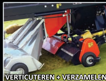
VERTICUTEREN + VERZAMELEN