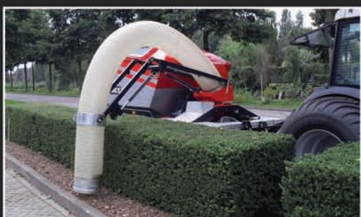
270° zwenkbare zuigarm