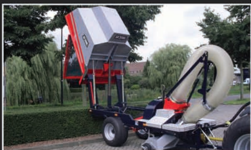
2.00 m hoogkipper